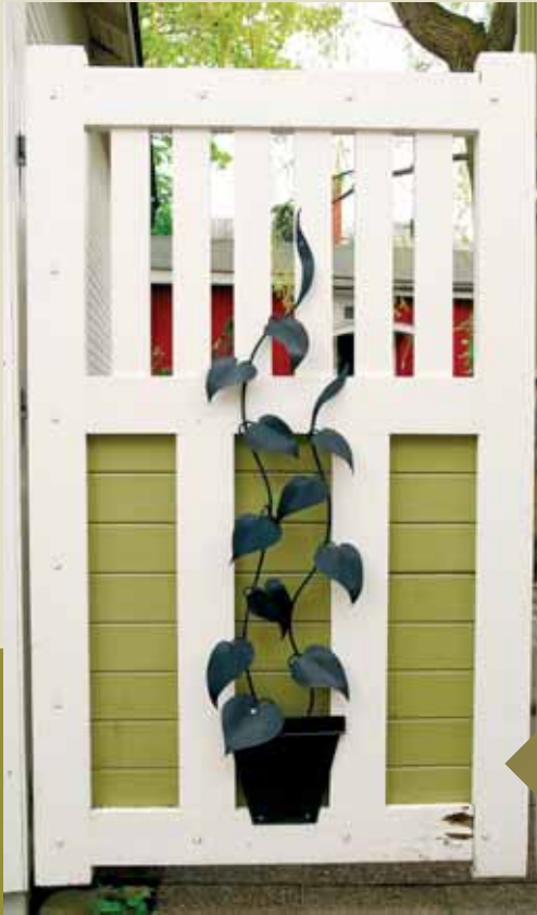
Yllä: Vanhan Rauman porttien koristeita. Oikealla: Offidan pitsiä.