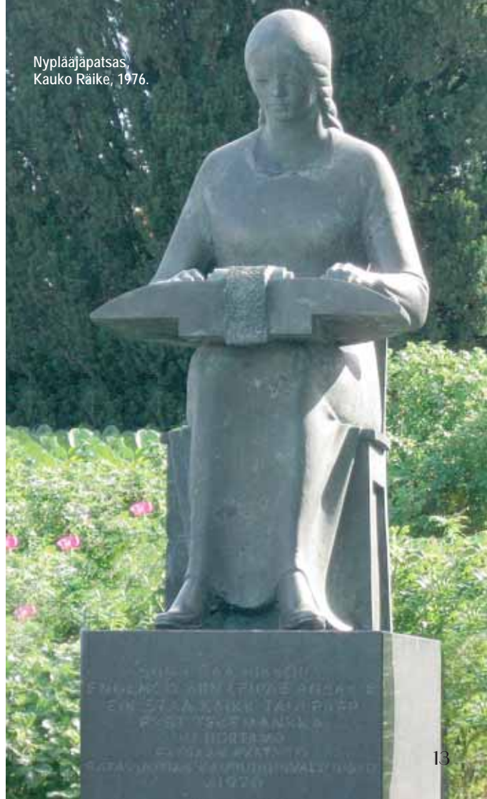
Nyplääjäpatsas, Kauko Räike, 1976.

Lasten Pitsiviikon ohjelma alkaa jo avajaisviikonloppuna: Murre ja Salainen tehtävä -seikkailuretket myös lauantaina ja sunnuntaina. Lisätiedot s. 19.