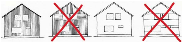
KUVA 3 Julkisivun käsittely