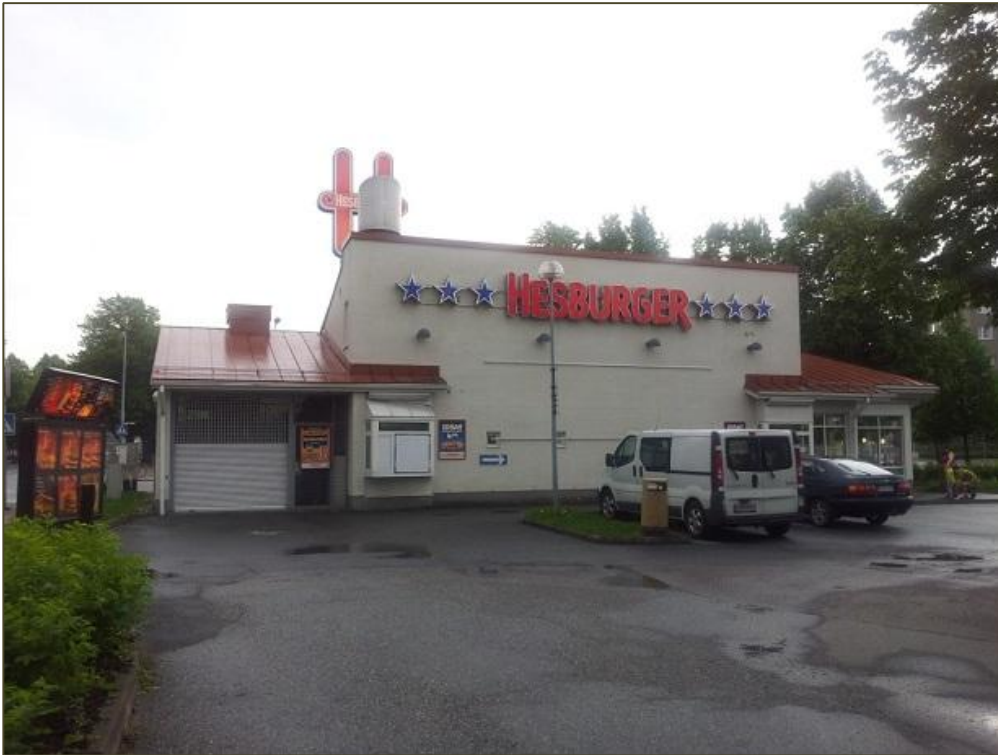
Drive-in -puoli rakennuksen pohjoissivulla.