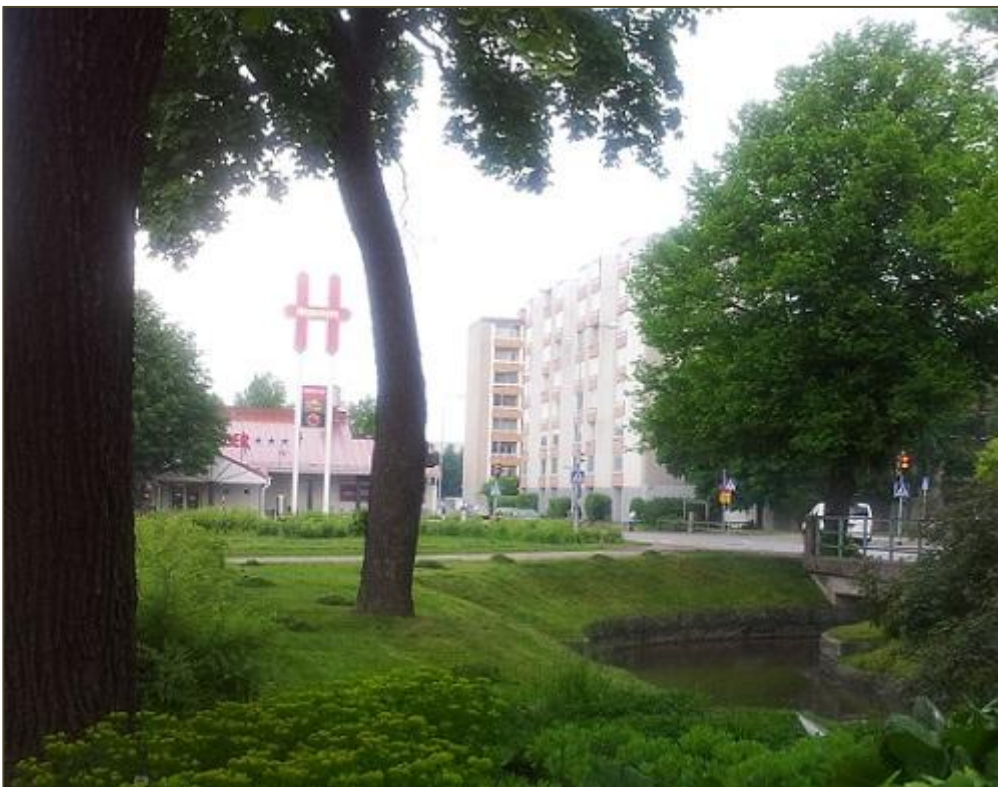
Näkymä Kanaalinrannasta Hesburgerin ja Tuulensuun suuntaan.