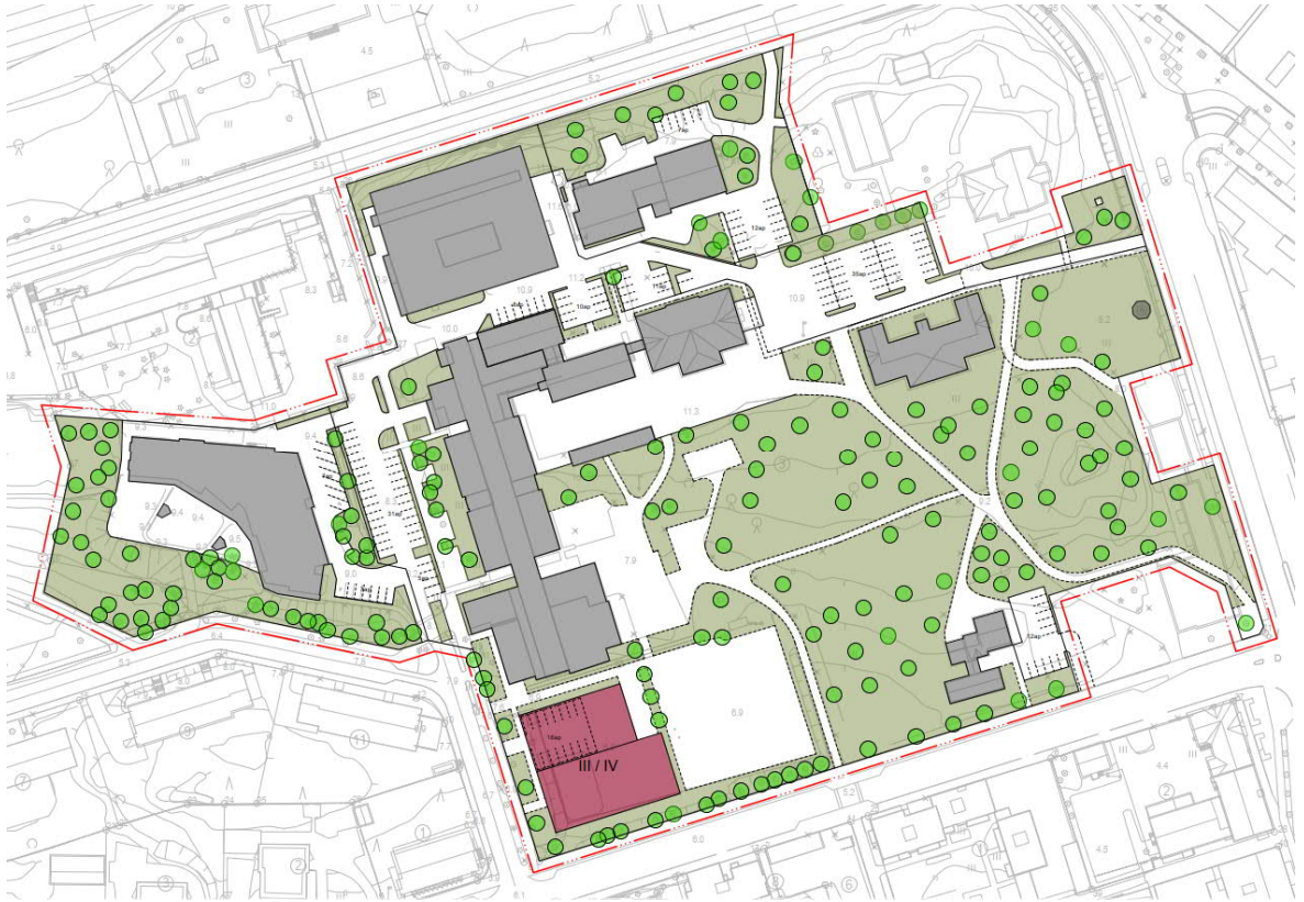
Kuva 2. Havainnepiirros