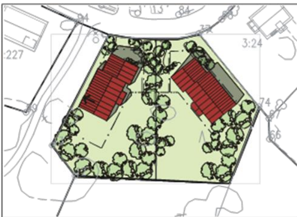
Kuva 1. Tonttien 31–3101–1 ja 31–3101–2 rakennusalat sekä esimerkki kaavan mukaisesta rakentamisesta.

Tontin katureunaan, kaavan osoittamalle alueelle on istutettava pensaita. Tontin rakennusala on osoitettu kevyenliikenteenväylän suuntaisesti, väylän varrelle ja rakennuksen tuleekin joltakin osin sijoittua kiinni rakennusalan luoteislaitaan (osoitettu kaavassa nuolella). Kuva 1.