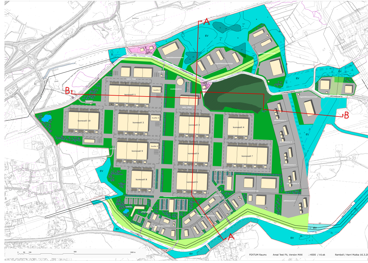
PAIKANNUSKAAVIO 1: 20 000